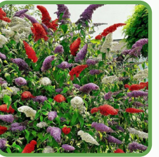
BEPLANTING zoals lavendel, sruisriet en vlinderstruik