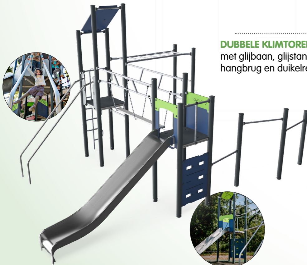
DUBBELE KLIMTOREN met glijbaan, glijstangen, hangbrug en duikelrek