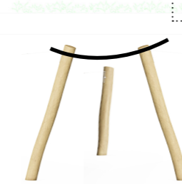
PALEN tbv hutten bouwen