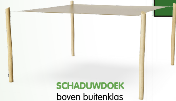
SCHADUWDOEK boven buitenklas