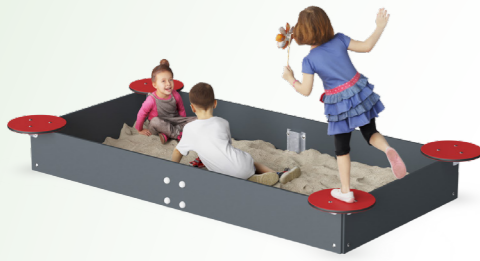
ZANDBAK met rode, ronde hoektafelijes