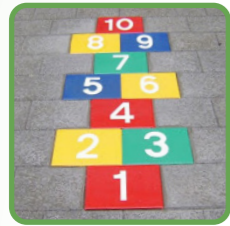
HINKELPAD van 1 tot 10